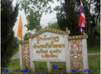
หินเกิดเจ้าศรีธรรมมา