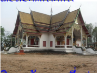
ซึ่งประดิษฐานพระเจ้าหลวง ( ในเรื่องเขียนให้เป็นที่เก็บรักษาปืนมาศค่า )