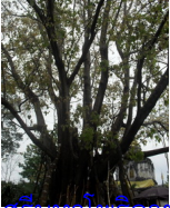
กูกิ่งใหญ่ที่พระมิ่งค์ ๗๐๐ ปีที่เจ้าม่านเหมยนำพระมิ่งค์ย้อนคืนสู่อดีตร้อยปีก่อน ( เทียบกับพระธาตุด้านหลังจะพบว่าต้นใหญ่มากก