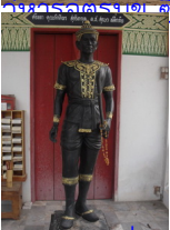
พระบรมรูปพญามังรายในวัดพระเจ้าล้านทอง